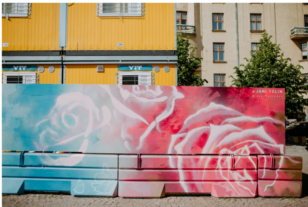
Ruusuja ja Totoro-hahmoja. Totorot alavasemmalla.